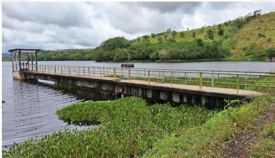
Figura 4: Passarela de acesso a Torre de captação e volantes de manobra.