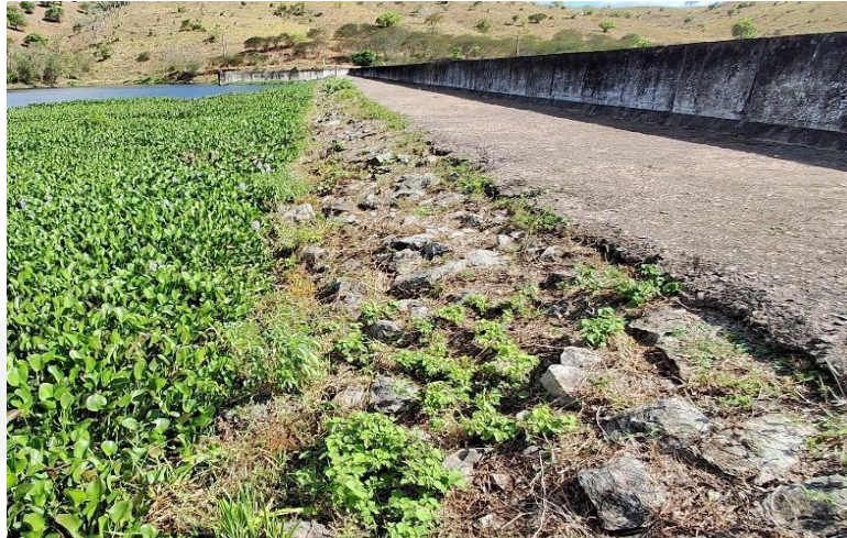
Figura 5: Detalhe do rip-rap com crescimento de vegetação.