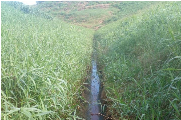
Figura 6: Detalhe da calha do pé de talude com crescimento da vegetação ao longo das bordas.