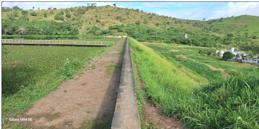
Figura 3: Crescimento de vegetação na crista, taludes, ombreiras e área jusante da barragem.

O maciço foi construído na passagem do Riacho Carangueja, bacia hidrográfica do rio Paraíba, Quebrangulo – AL, entorno das coordenadas 09°18'10.60"S e 36°28'40.95"O, formando uma área de contribuição de 39,82 km 2 , volume de 4.711.040m 3 e espelho d'água com 700.000m 2 . Os principais componentes e detalhes da Barragem Carangueja, podem ser observados nas fotos das figuras 3 a 7.