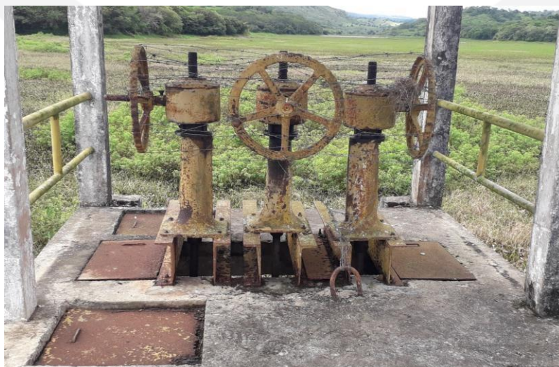
Figura 7: Detalhe dos volantes e tampas de ferro na Torre de captação.