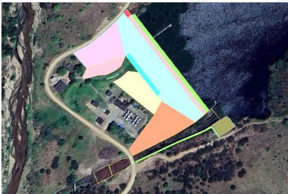
Figura 8: Áreas hachuradas indicando localização dos serviços.