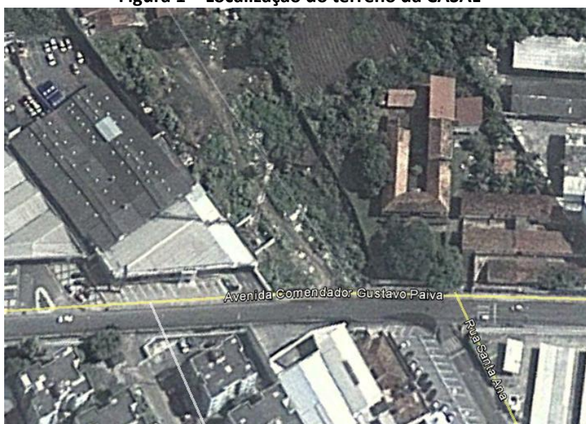
Figura 1 – Localização do terreno da CASAL

O supracitado terreno está localizado na Avenida Comendador Gustavo Paiva próximo ao prédio da SOCOCO.