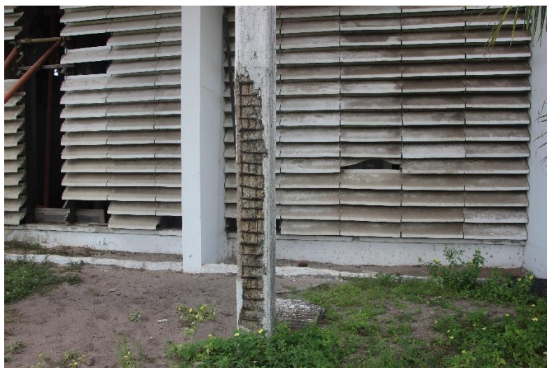
Figura 4. Deslocamento do concreto nos pilares

Pelas figuras é possível observar a existência de pilares com deslocamento do concreto, a viga de apoio da calha apresenta manchas de vazamentos