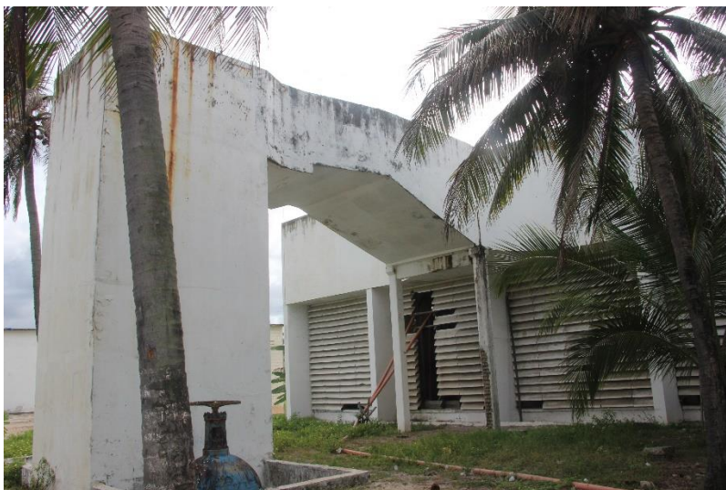
Figura 3. Vista lateral da calha Parshall

A calha Parshall pertence ao conjunto de equipamentos que alimentam a caixa de areia do emissário submarino.