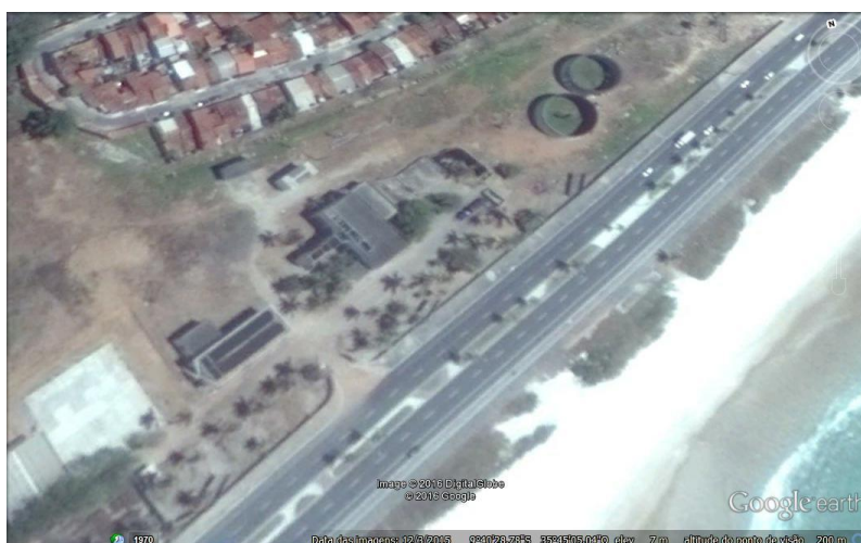
Figura 2. Vista superior do sistema do Emissário