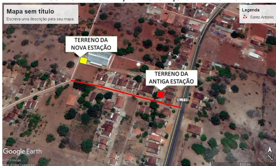
FIGURA 01 – LOCALIZAÇÃO DAS ESTAÇÕES ELEVATÓRIAS.

Tendo em vista atender por meio da CI 189/2017 (Protocolo 9339/2017) a Unidade Serrana, com a inclusão de uma nova Estação Elevatória de Água Tratada (EEAT) do povoado Santo Antônio no município de Palmeira dos Índios, pois a existente, além de necessitar de adequações em sua estrutura física, está construída em um terreno de propriedade particular. Com isso, se faz necessário um projeto básico para a construção de uma nova estação elevatória num terreno doado pela prefeitura localizado a 200 m da elevatória existente (FIGURA 01).